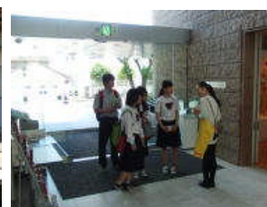
<集合場所大阪城公園駅>