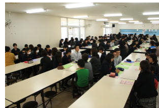
< 11/9 授業参観 >

11日(月)~15日(金)の5日間、合計54の事業所で、職場体験学習をすることができました。各事業所では中学生の受け入れにご協力いただき、丁寧に指導していただき、大変お世話になりました。生徒たちは、実際に働くことを通して、仕事のやりがいや苦勞、働くことの尊さについて考えたり、自分自身について振り返ったりと様々な体験をしました。