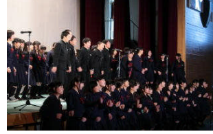
< 3年生合唱 Live While We're Young >