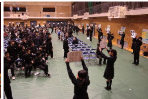
< 2年生京大訪問 ポスターセッション >