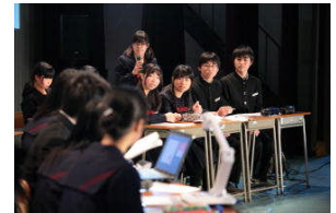
< 3年生 ディベートマッチ >