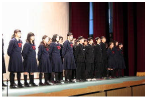
< 1年生群詠 >

3月8日(土)、本校体育館で「桐蔭キュリオ・桐の葉発表会」を開催しました。保護者、入学予定の8期生の前で、本年度「桐蔭キュリオ」「桐の葉」で学習したこと、成果を発表しました。舞台、発表、フロア全体を使ったポスターセッション、展示等それぞれの形式で、一年間の学習成果を伝えました。授業で取り組んできたことに、さらに磨きをかけてそれぞれの創意工夫が生かされたすばらしい内容でした。