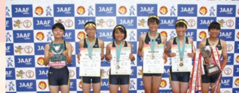
第46回全日本中学校陸上競技選手権大会