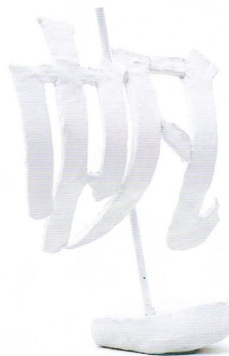
生徒作品 帆 [加工粘土・園芸用パイプ・針金/ 23×12×17cm]