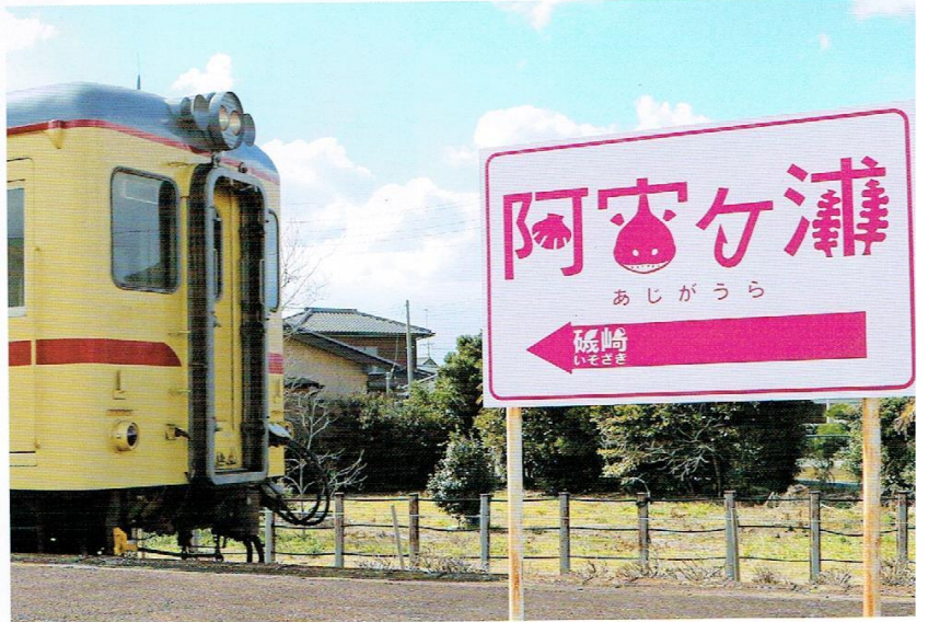
駅名標 海産物の豊富な阿字ヶ浦海岸(茨城県)沿いにある駅。貝、あんこう、釣り針、海藻が描かれている。