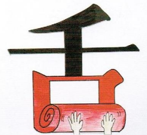
生徒作品 舌を巻く [鉛筆・ペン・紙/19×26.8cm]