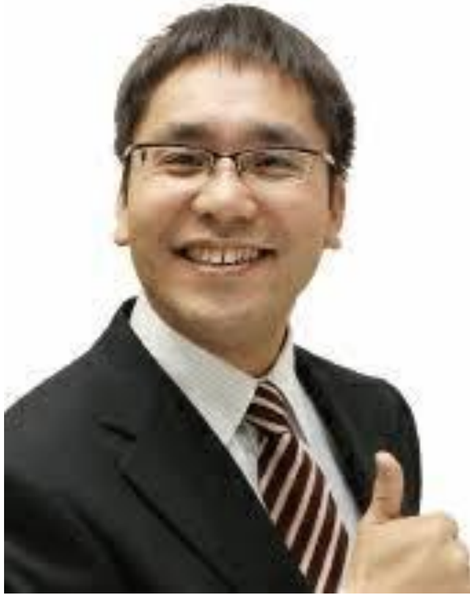
上田情報ビジネス専門学校 副校長